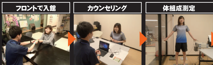
フロントにてチェックイン！ さあ、運動スタートです。