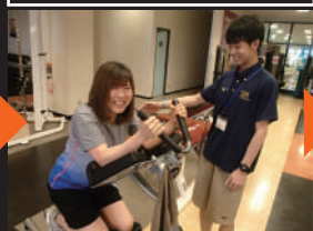
あなたに合わせた種目をトレー ナーが丁寧にご案内いたします。