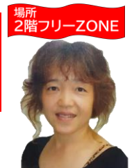
C、C、Yエアロピクスインストラクター 養成学校 はずみ

施設利用 / 17時45分～20時05分 持ち物 / シューズ、水分、汗拭きタオル カルチャー会員 9,350円(税込) グループ店舗会員 7,150円(税込)