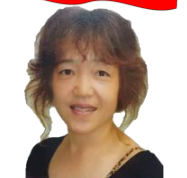
C.C. Yエアロピクスインストラクター養成学校 はつみ